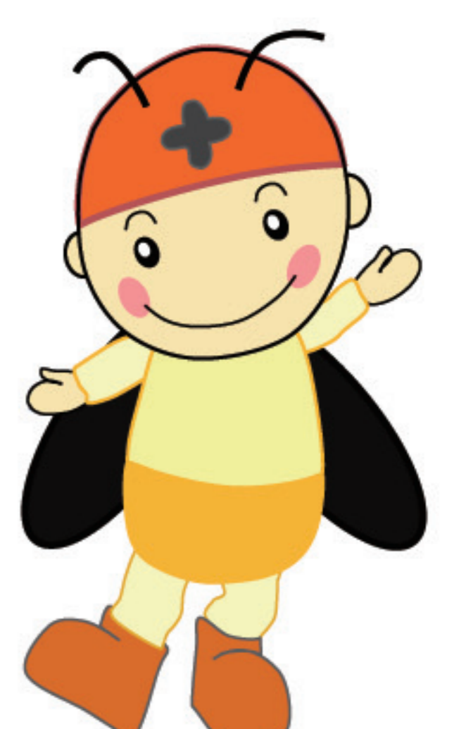
豊田町観光大使「ほたるん」