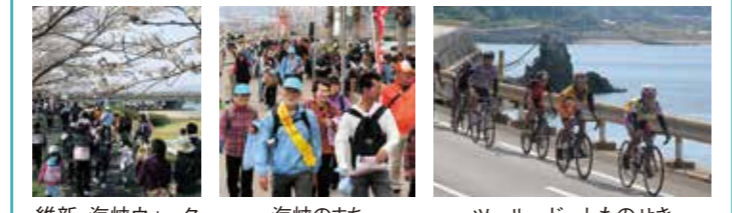
維新・海峡ウォーク 海峡のまち下関歴史ウォーク ツール・ド・しものせき ■お問い合わせ先 下関市観光スポーツ文化振興課 TEL:083-231-2729

下関市で開催されるビッグスポーツイベントである「下関海響マラソン」、「維新・海峡ウォーク」、「海峡のまち下関歴史ウォーク」、「ツール・ド・しものせき」を「走る・歩く・乗る」の3つの部門の認定対象大会とし、各大会の対象部門を完歩、完走した方を「海響アスリート」として認定する制度です。認定者には、認定証及び記念品を贈呈します。(申請が必要です)