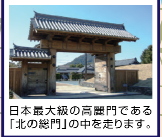
日本最大級の高麗門である「北の総門」の中を走ります。