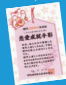
恋愛成就手形バージョン