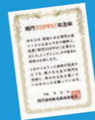
勝利の神社・恋人の聖地バージョン