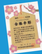
合格手形バージョン