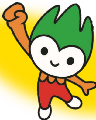
山口県PR本部長 「ちよるる」