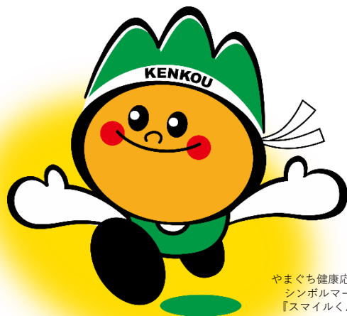
やまぐち健康応援団 シンボルマーク 『スマイルくん』